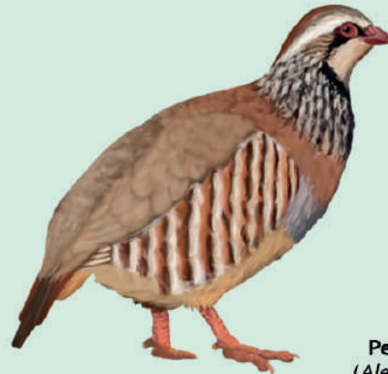
Perdiu roja ( Alectoris rufa )

A les lloses de les voltes de les barraques hi podem observar ratpenats, i a les construccions més remotes hi fan el cau la guilla, el teixó i el gorjablanc.