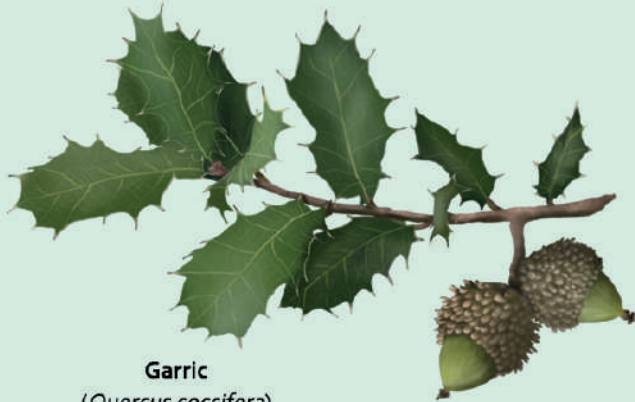
Garric ( Quercus coccifera )

A causa de la fil·loxera, a finals de segle XIX, i de l'ús dels olis industrials, a principis del segle XX, es van abandonar la majoria dels camps de conreu de la Garriga. Això ha propiciat la recuperació de la vegetació natural, que es caracteritza per zones de matollars de garric i alzinar, per prats secs i llistonars, on podem observar diferents espècies d'orquídies a la primavera com l'abellera vermella i, molt especialment, l'abellera catalana, una espècie protegida.