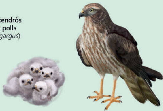
Esparver cendrós femella i polls ( Circus pygargus )

Una molèstia per aquesta espècie, és la freqüentació a les seves zones de nidificació. Per tant, és important que quan accedim a aquest territori, ho fem d'una manera responsable, seguint els camins marcats, i si pot ser, amb el màxim silenci possible.