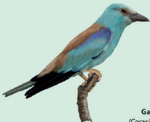
Gaig blau ( Coracias garrulus )

Té un cant molt sonor que sol emetre en vol amb la parella durant el festeig.