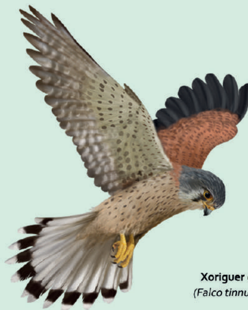
Xoriguer comú ( Falco tinnunculus )

El xoriguer és un petit falcó que podem veure tot l'any, és força freqüent i fàcil d'observar i de distingir, sobretot per la seva manera de volar quan caça. És de mida mitjana, amb el plomatge de color castany clar puntejat de castany fosc i té el cap una mica grisenc.