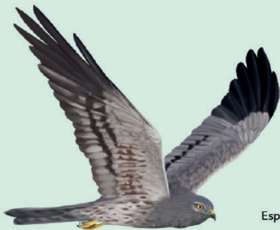
Esparver cendrós mascle ( Circus pygargus )

L'esparver cendrós és una de les principals raons per les quals la Garriga d'Empordà és un espai natural protegit. És una espècie amenaçada que té en aquesta àrea un dels pocs hàbitats a les comarques de Girona.