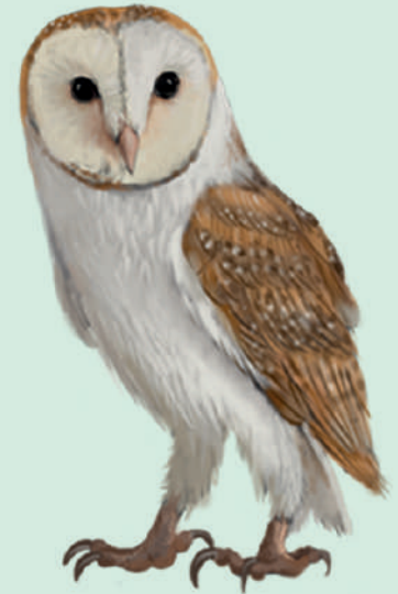
L'òliba o xibeca ( Tyto alba )

De nit, o al crepuscle, l'òliba caça petits rosegadors, bàsicament talpons, musaranyes i ratolins.